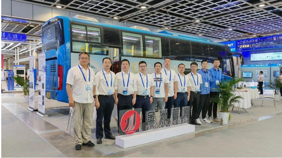
9月1日，金洲管道亮相中国城镇水务发展大会。

金洲管道亮相 2022 第六届中国石油和化工行业采购大会并荣获“2021 年度石化行业百佳供应商”